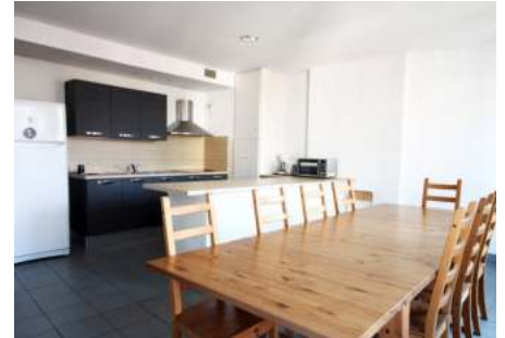
Bilder oben: Wohnbeispiel Studenthouse Campus Residente