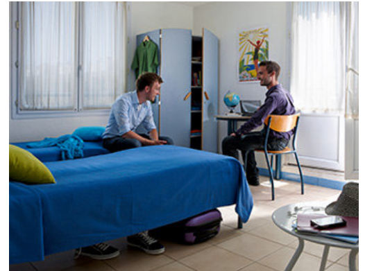
Wohnbeispiel Bilder oben: Castel Arabel alter Teil des Gebäudes, Wohnbeispiel Studio Antibes