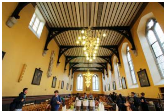
Bild Rechts: „The Hall“, in der die Malzeiten eingenommen werden.

Beide Summerschools liegen ca. 15-20 Minuten mit der Dart (so nennt man die Straßenbahn in Dublin) von der Dublin City entfernt. Die Summerschools haben aber auch eigene Shuttlebusse für Ausflüge und die meisten Cityfahrten.