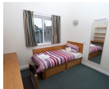
Bilder oben: Wohnbeispiel Deans Hall