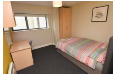
Bilder oben: Wohnbeispiel Copley Court