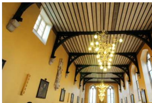
Bild Rechts: „The Hall“, in der die Malzeiten eingenommen werden.

Beide Summerschools liegen ca. 15-20 Minuten mit der Dart (so nennt man die Straßenbahn in Dublin) von der Dublin City entfernt. Die Summerschools haben aber auch eigene Shuttlebusse für Ausflüge und die meisten Cityfahrten.