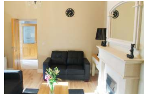
Wohnbeispiel oben: Zephyr Lodge

Auf Wunsch ist ein Aufenthalt ohne Malzeiten möglich. In dem Falle empfehlen wir ihnen jedoch ein Auto zu mieten, so dass Sie zum Supermarkt fahren können.