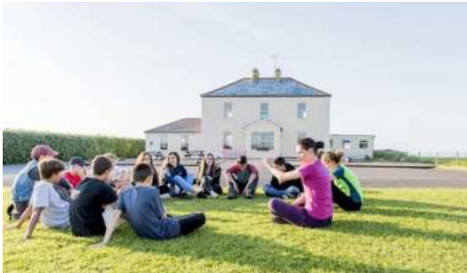
Foto: Englisch Unterricht für Jugendliche im Sommer vor dem Schulgebäude

Englisch und Surfen und Englisch und Reiten