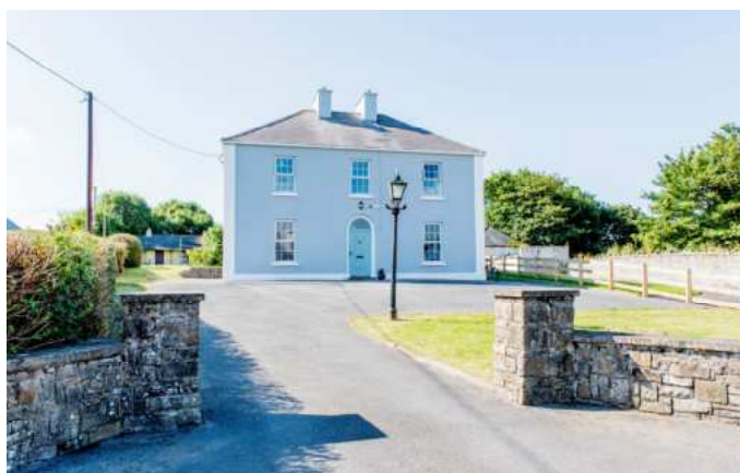
Bild oben: historische Residenz, „Old Farmhouse“ mit schön eingerichteten Zimmern und einer wohnlichen Atmosphäre. Nach der Renovierung im letzten Jahr, wird es von den Besitzern liebevoll „Casa del Mar“ genannt (weil es blau ist, die Einrichtung wie ein Strandhaus und am Meer liegt... und es ist wunderschön!) Nur solange Zimmer frei.

Kursteilnehmer haben die Wahl zwischen verschiedenen Residenzen und Gastfamilien Unterkunft.